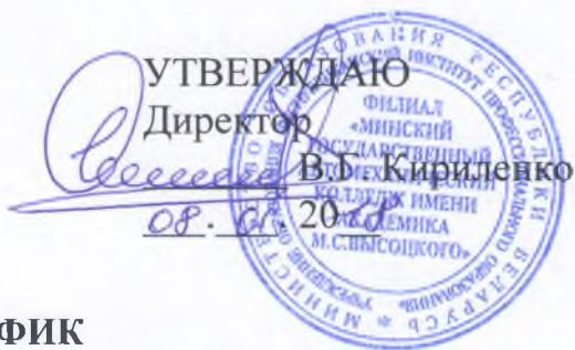
ГРАФИК работы объединений по интересам филиала «Минский государственный автомеханический колледж имени академика М.С. Высоцкого» учреждения образования «Республиканский институт профессионального образования» на II семестр 2017-2018 учебного года